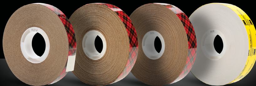
Scotch® ATG Adhesive Transfer Tape 924